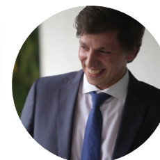
Antonino Sousa Hospital Pedro Hispano Matosinhos, Portugal