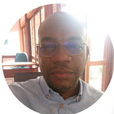
Eugénio Neves Direção Geral de Turismo e Hotelaria de São Tomé e Príncipe